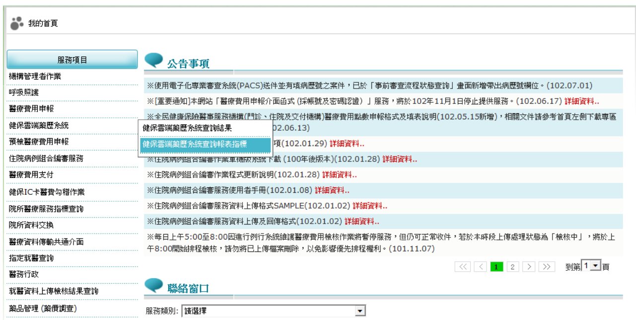
圖-3 健保資訊網服務系統（VPN）我的首頁