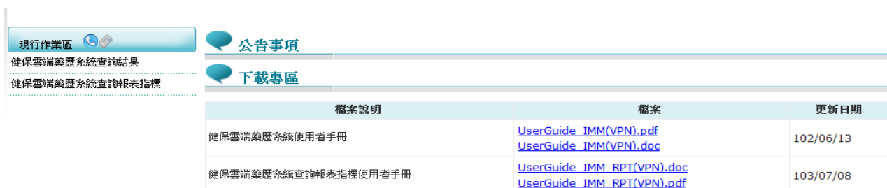
圖-2 健保資訊網服務系統 (VPN) 我的首頁