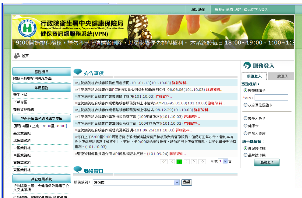
圖-1 健保資訊網服務系統 (VPN) 首頁

(一) 服務機構進入健保資訊網服務系統 (VPN) 平台後，將電子憑證插入讀卡機，選擇憑證種類及輸入憑證相關資料，按「憑證登入」鍵，進入如下畫面的「我的首頁」(圖-2)，左邊「服務項目」將顯示該登入人員個人所屬權限的作業清單。